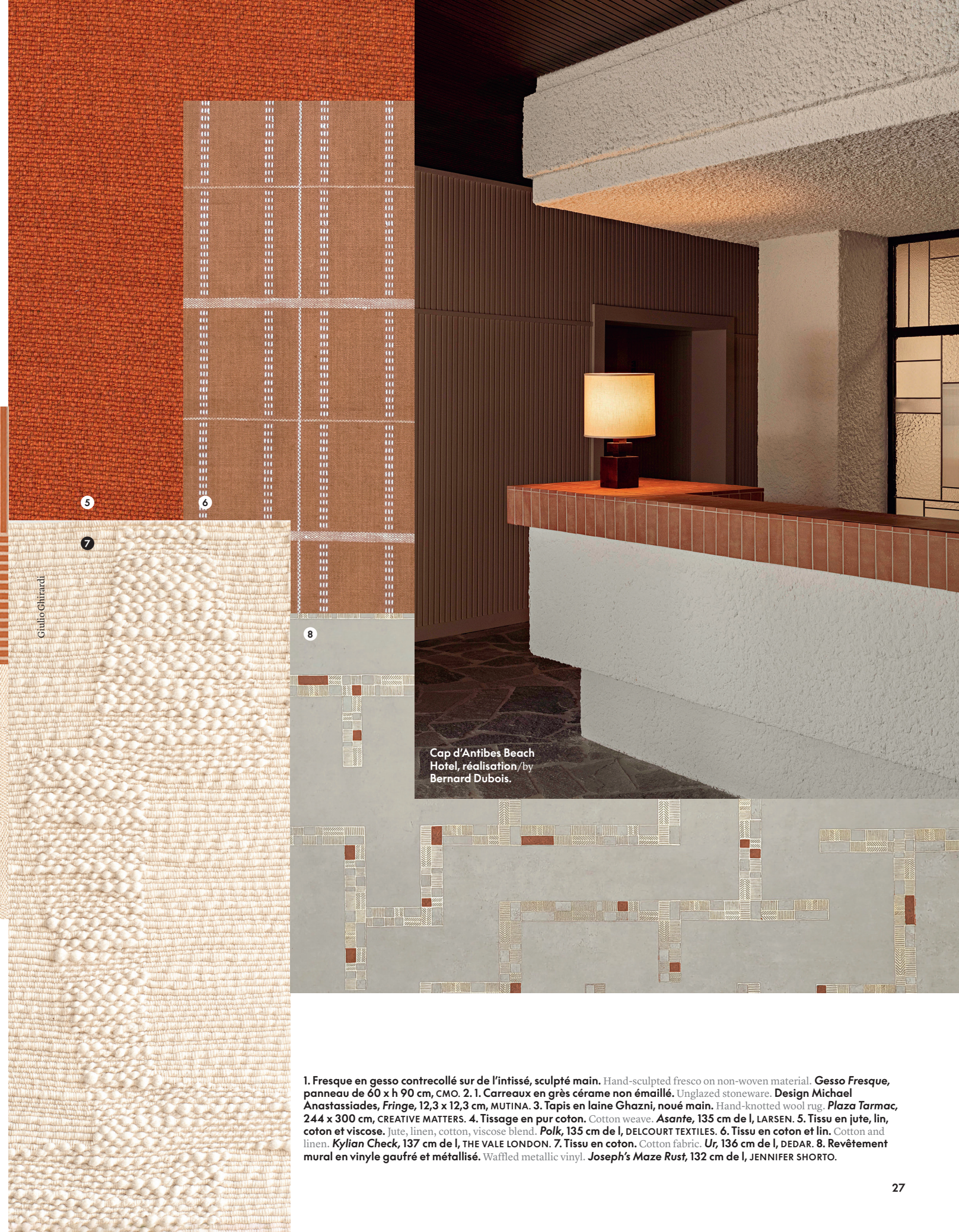
Cap d'Antibes Beach Hotel, réalisation/by Bernard Dubois.